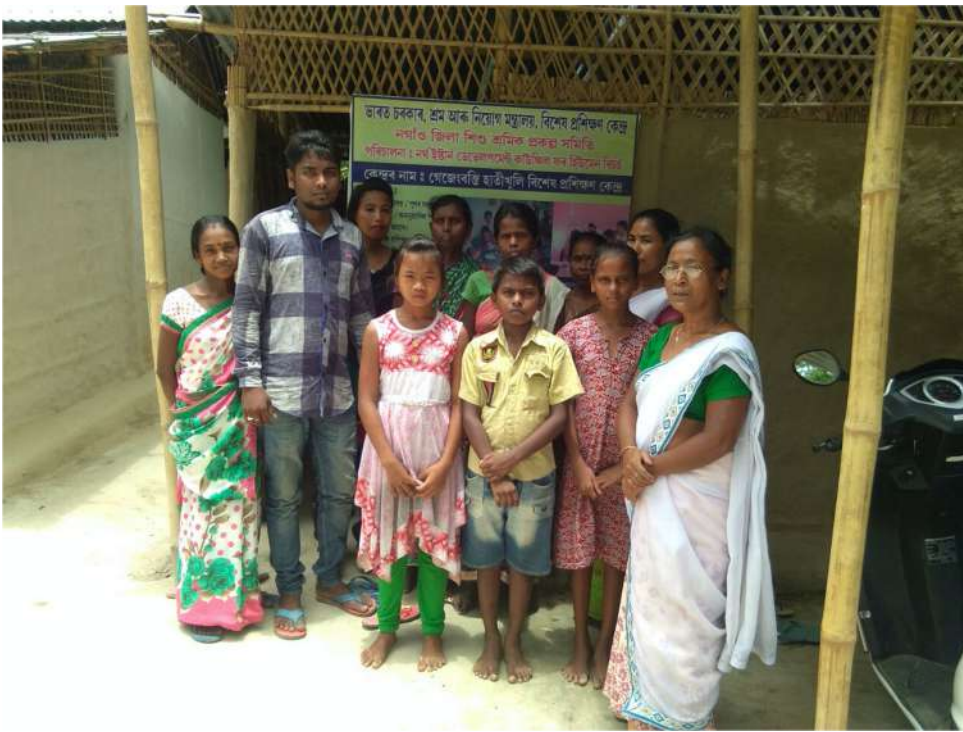
स्कूल में बच्चों का नामांकन